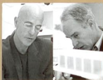
HERZOG & DE MEURON